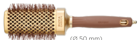
(Ø 50 mm)