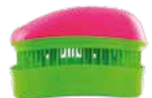
32112 Fuchsia - Lime

VEŠKERÉ ZMĚNY (CEN APOD.) A TISKOVÉ CHYBY V TOMTO LETÁKU JSOU VYHRAZENY! AKČNÍ NABÍDKA A SLEVY PRO KADEŘNICKÉ SALONY V ČR A SR PLATNÁ V OBDOBÍ 1. 7. - 30. 9. 2026. CENY JSOU UVEDENY VČETNĚ DPH.