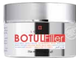
Botul Filler Mask