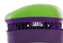
32111 Green - Purple