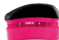
32110 Black - Fuchsia