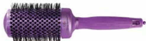
Ceramic + ion NanoThermic 54 (Ø 54 mm)