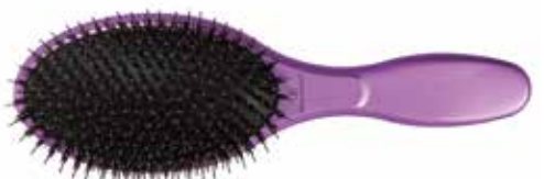
Směs 100% kančích a nylonových štětín zakončených kuličkou