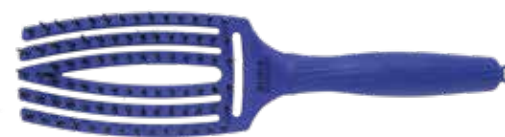
Fingerbrush Tropical Blue