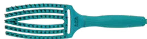
Fingerbrush Tropical Ocean