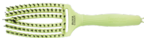
Fingerbrush Tropical Lime