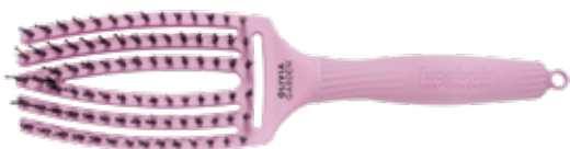
Fingerbrush Bloom Lotus