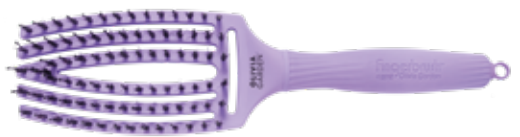
Fingerbrush Bloom Lavender