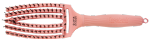
Fingerbrush Bloom Peach