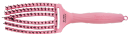
Fingerbrush Bloom Lily