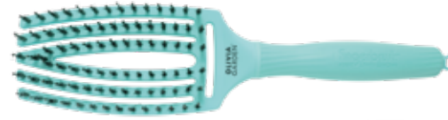
Fingerbrush Tropical Mint